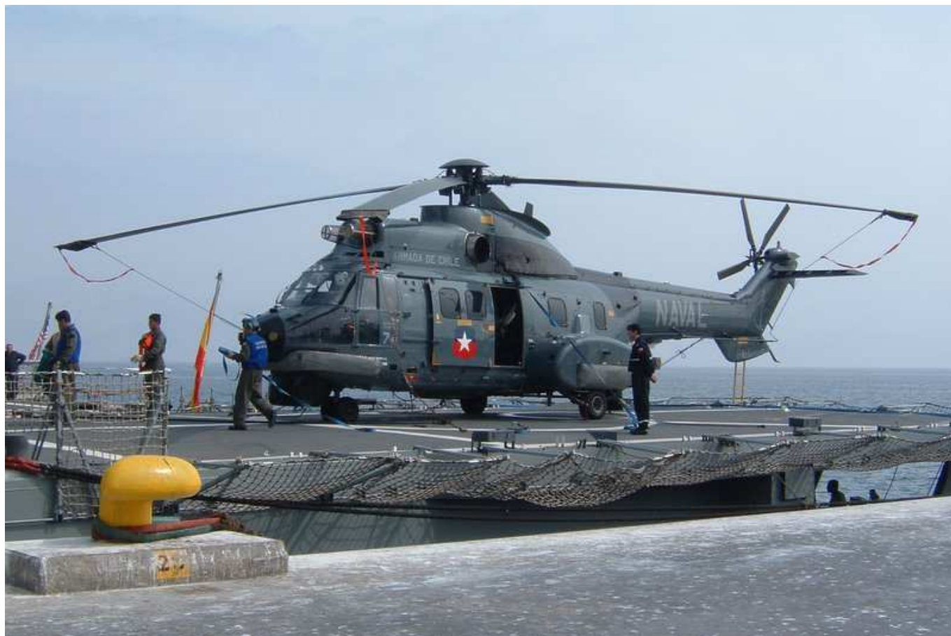
Helicóptero Cougar da Armada do Chile em um convoo de um navio atracado