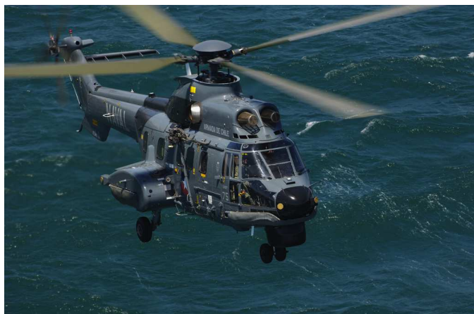
Símbolo do Cougar, no Chile

Segundo o site "Poder Naval" o Chile faz um uso diferente do Cougar, que também é operado pela Marinha do Brasil: